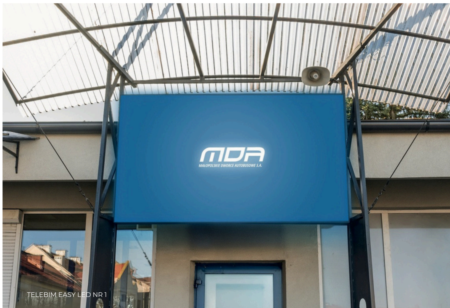
TELEBIM EASY LED NR 1