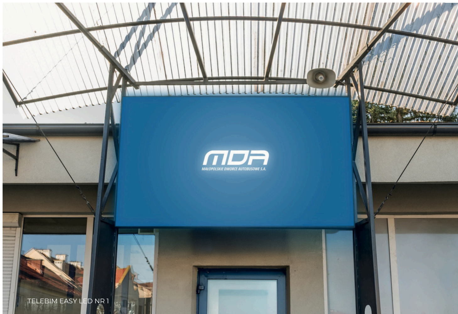
TELEBIM EASY LED NR 1